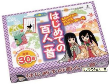
【(G)-1】はじめての百人一首 (初級者用)