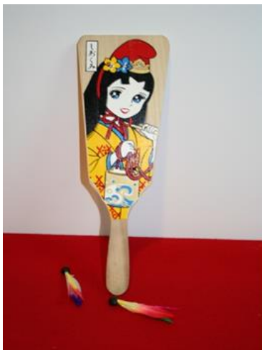
【(G)-5】羽子板セット (羽付)