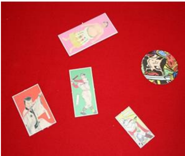
【(G)-27】 めんこ (数種セット)