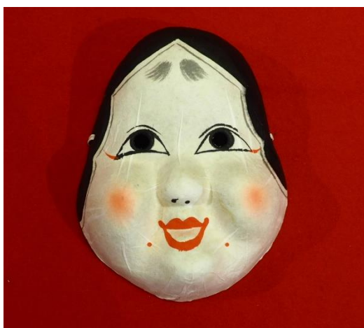
【(G)-11】 お面 (おかめ)