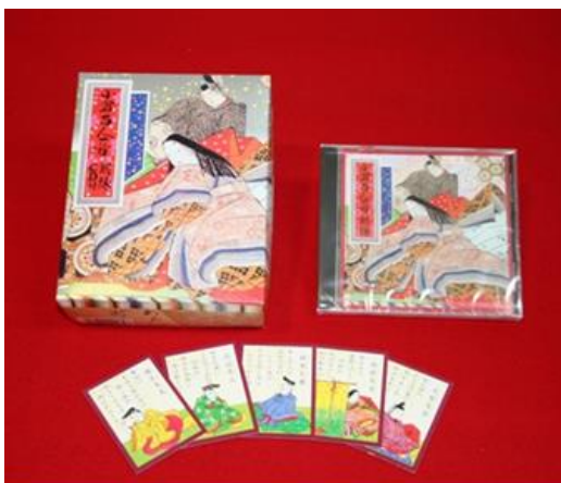
【(G)-3】小倉百人一首 (CD 付き)