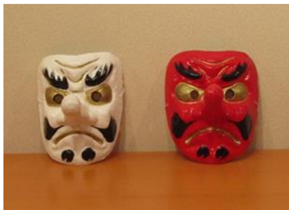
【(G)-8】 天狗面 (赤/白)