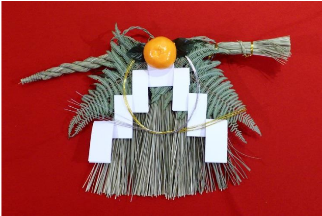
【(B)-24】春節裝飾玩具組合(10 樣)