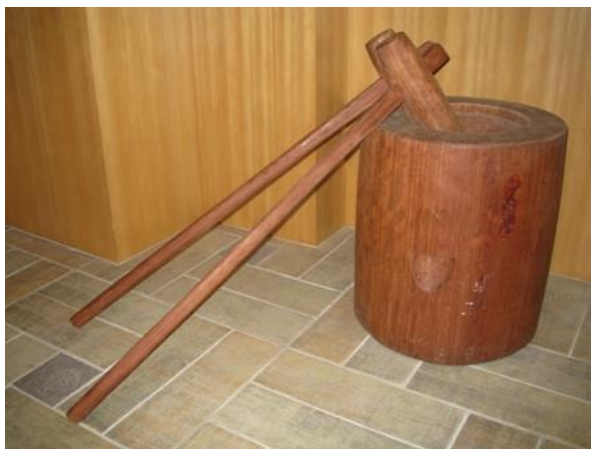
【(B)-15】臼&杵(搗日式麻糬用) 臼：直徑 45cm×高 51cm×重 60kg 杵：長 105cm×重 1.5kg