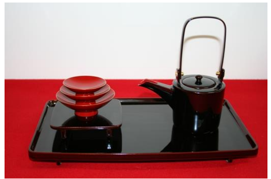
【(B)-14】酒器(元旦用) 長 36cm×寬 32cm×高 30cm