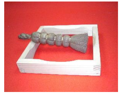
1-(16). 底洗+1-(22). 釜据