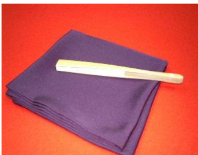
1-(17). 扇子+1-(18). 帛紗