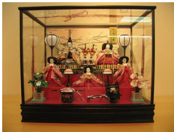
【(B)-2】女兒節人偶(玻璃櫃內)