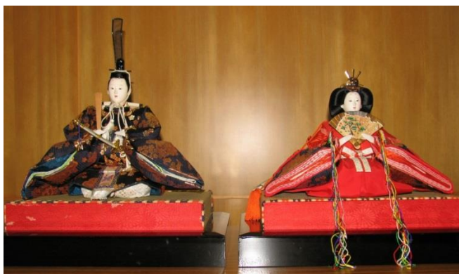
【(B)-1】女兒節人偶(無玻璃櫃)