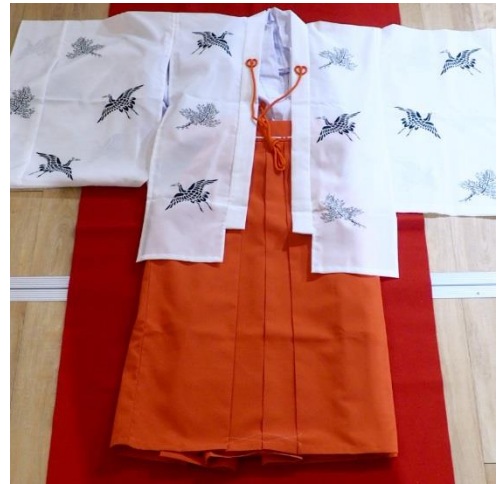
【(D)-10】巫女常衣 上下セット (行灯袴) + 千早青摺入