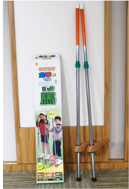
【(G)-32】高蹺 高 150~185cm