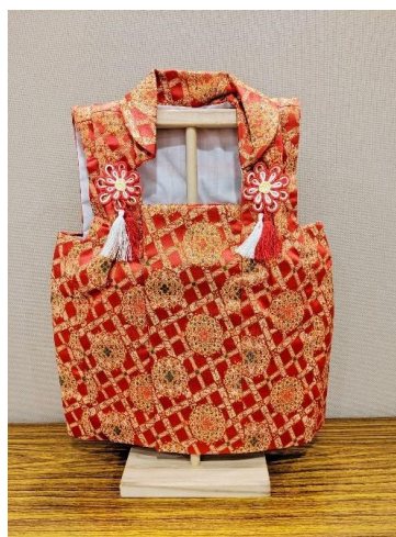
【(D)-20】七五三節 女童用紅色被布 (附展示架/展示用)