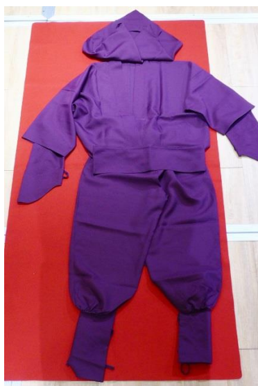
【(D)-11】伊賀忍者装 顏色：紫、紅、黑、深藍