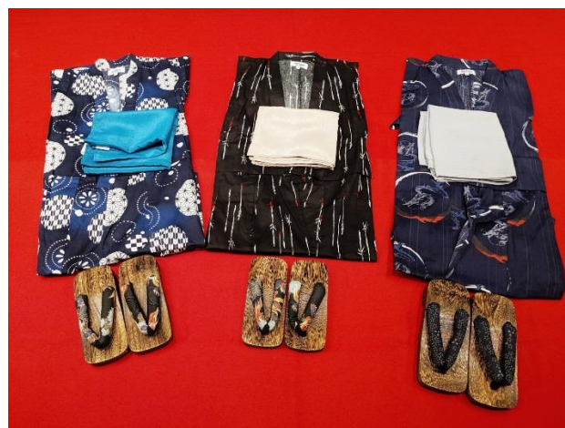
浴衣 110cm 浴衣 120cm 浴衣 130cm 木屐 18cm 木屐 19.5cm 木屐 21cm