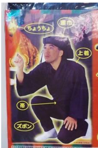
【(D)-13】黒子装(黒衣演員装)