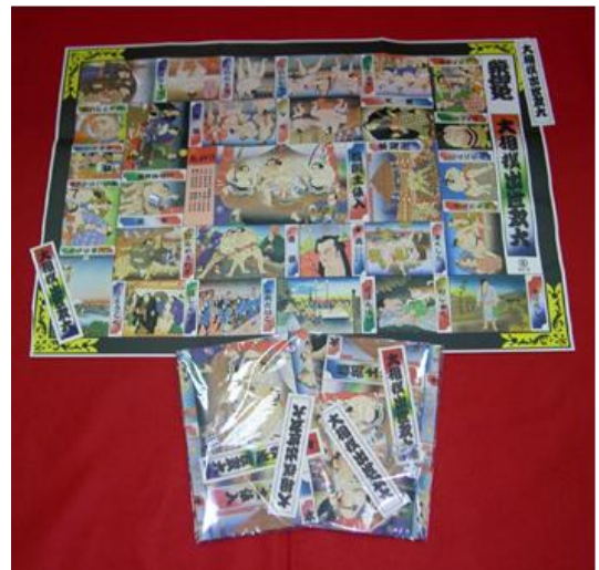
【(G)-28】日式大富翁(相撲版)