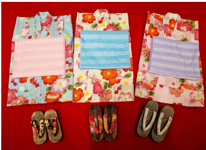
浴衣 110cm 浴衣 120cm 浴衣 130cm 下駄 18cm 下駄 19.5cm 下駄 21cm