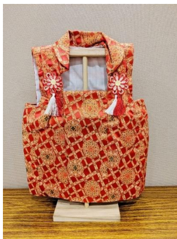
【(D)-20】 子供用 被布着 (お祝い着) (展示用/スタンド付き)