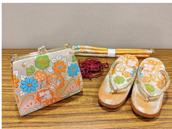
【(D)-21】 子供用 和装小物 (展示用)