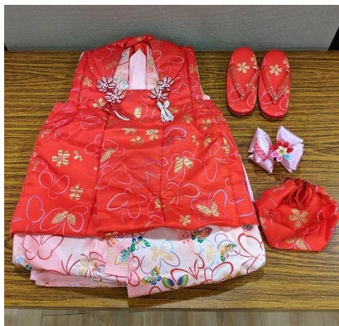
【(D)-19】 子供用お祝いセット (女の子) (展示用)