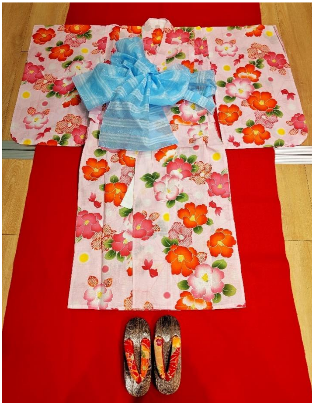
【(D)-23】 子供用浴衣 (女の子) セット 帯、下駄付き