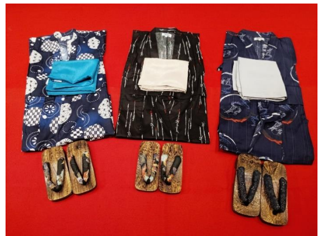
浴衣 110cm 浴衣 120cm 浴衣 130cm 下駄 18cm 下駄 19.5cm 下駄 21cm