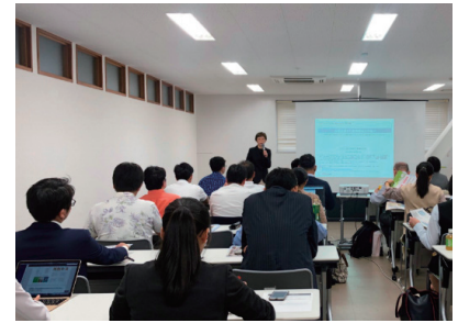
沖縄セミナー 2019年11月19日

会場：なは産業支援センター 主催：那覇市（ジェトロ沖縄運営） 共催：日本台湾交流協会、台湾貿易 センター福岡事務所、TJPO