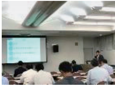
千葉セミナー 2019年9月18日

会場：千葉商工会議所 主催：日本台湾交流協会、ジェトロ 千葉、TJPO、ちば海外ビジ ネスサポートセンター