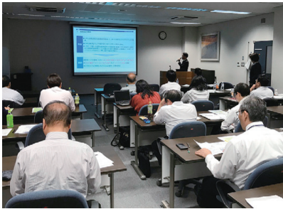
富山セミナー 2019年5月16日