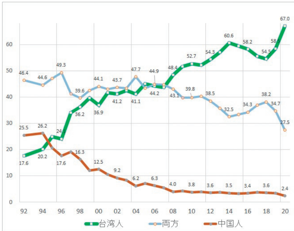
図 A 台湾民衆の自己アイデンティティ認識 (台湾人、中国人、両方)