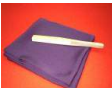
1-(17). 扇子+1-(18). 帛紗