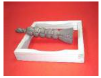
1-(16). 底洗+1-(22). 釜据