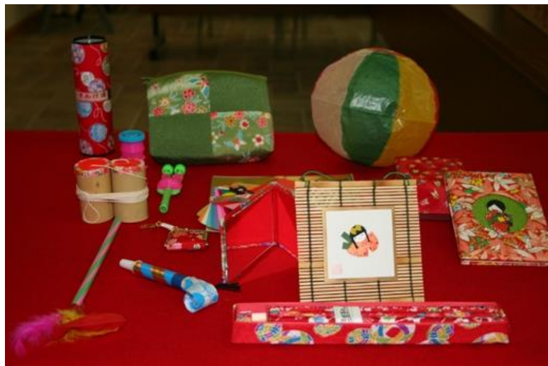
【No. 98】春節應景組合(玩具)