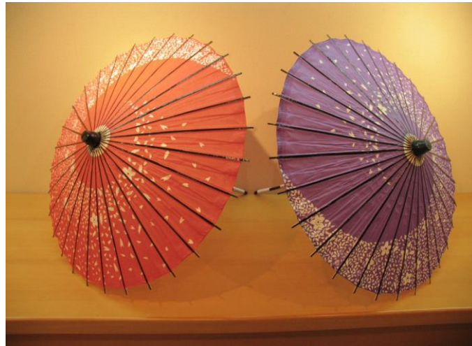
【No. 42】羽拍裝飾用（大） （寬54×長23）