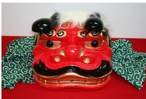
【No. 56】獅子舞 (舞獅用) (頭部：寬27×長35×高24) 全長225