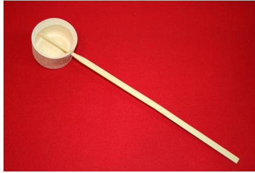
【No. 48】酒杯 (1合用)