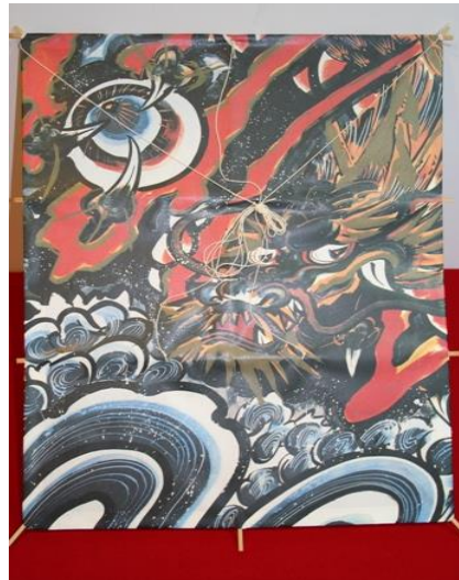
【No. 77】和凧 (奴凧) (縦66×横48)