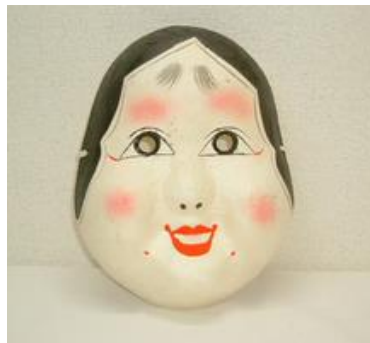
【No. 74】紙面（ひょっこ） サイズ (21.5cm ×14cm)