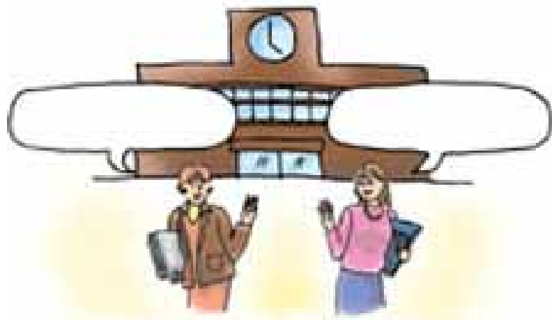
新文化初級日本語①CD-ROM 光碟 (大新書局)