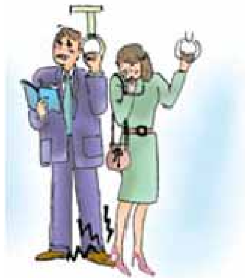
新文化初級日本語①CD-ROM 光碟 (大新書局)