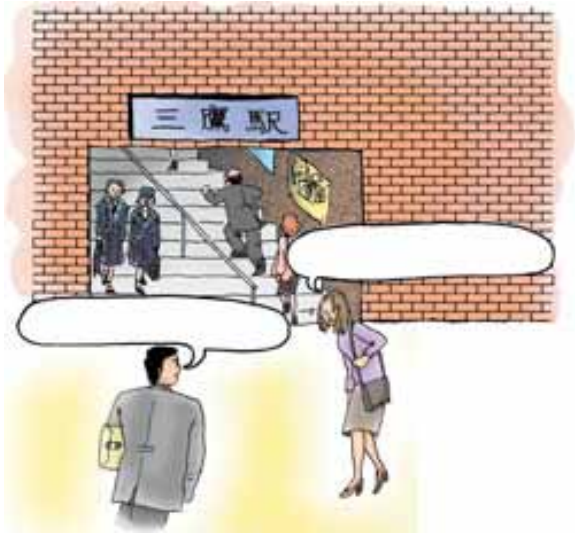
新文化初級日本語①CD-ROM 光碟 (大新書局)