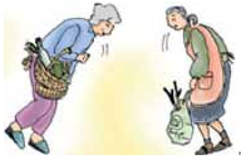
新文化初級日本語①CD-ROM 光碟 (大新書局)