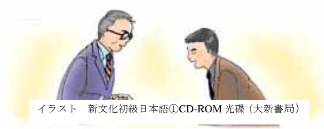
イラスト 新文化初級日本語①CD-ROM 光碟 (大新書局)