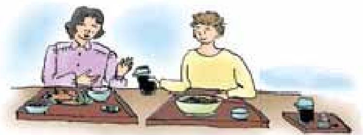
新文化初級日本語①CD-ROM 光碟 (大新書局)