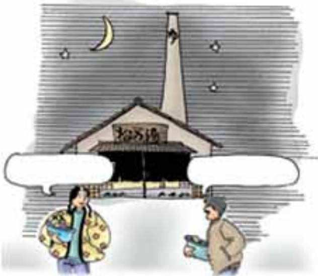
新文化初級日本語①CD-ROM 光碟 (大新書局)