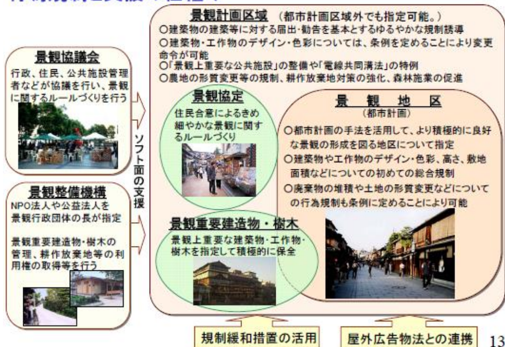
圖2 日本景觀法架構層級