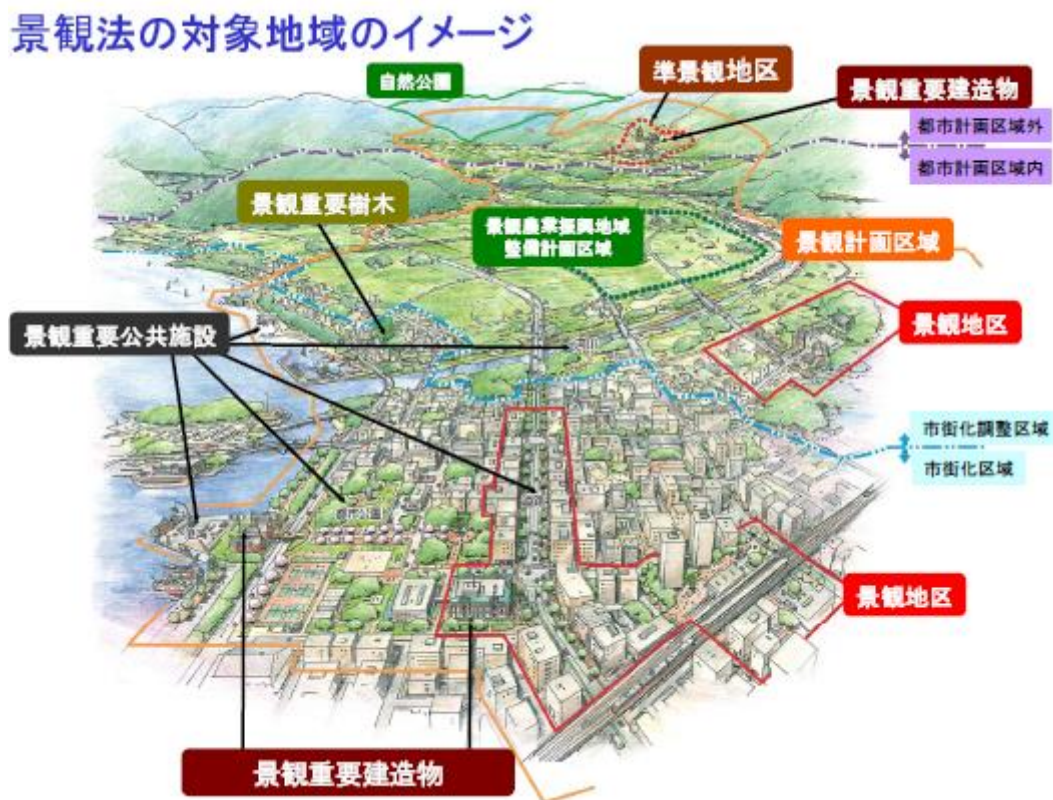
圖 1 景觀計畫之施行對象