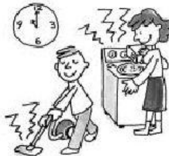
吸塵器或洗衣機的聲音