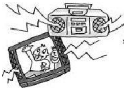
電視、收音機、揚聲器的聲音