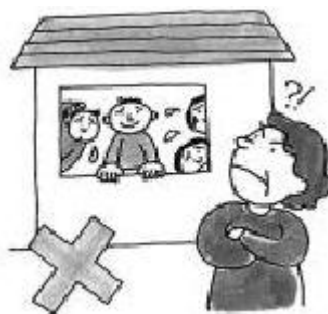
將房屋轉租給他人。