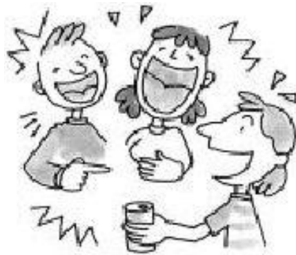
聚會時的大聲說笑與大音量的音樂