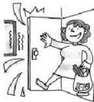
用力開門關門時的聲音