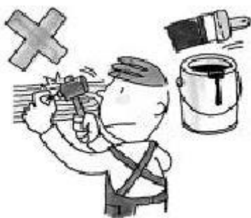
在房屋內釘釘子、塗油漆。

未經房主許可，承租人不可對房屋進行改造或內部裝修，不可與非家庭成員同住。當然，也不能把房屋的一部分或全部再轉租給其他人。