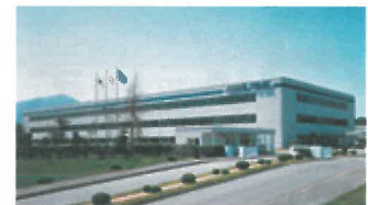
阿爾派 磐城總公司